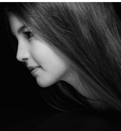
SEER: Simulative Emotional Expression Robot, Takayuki Todo